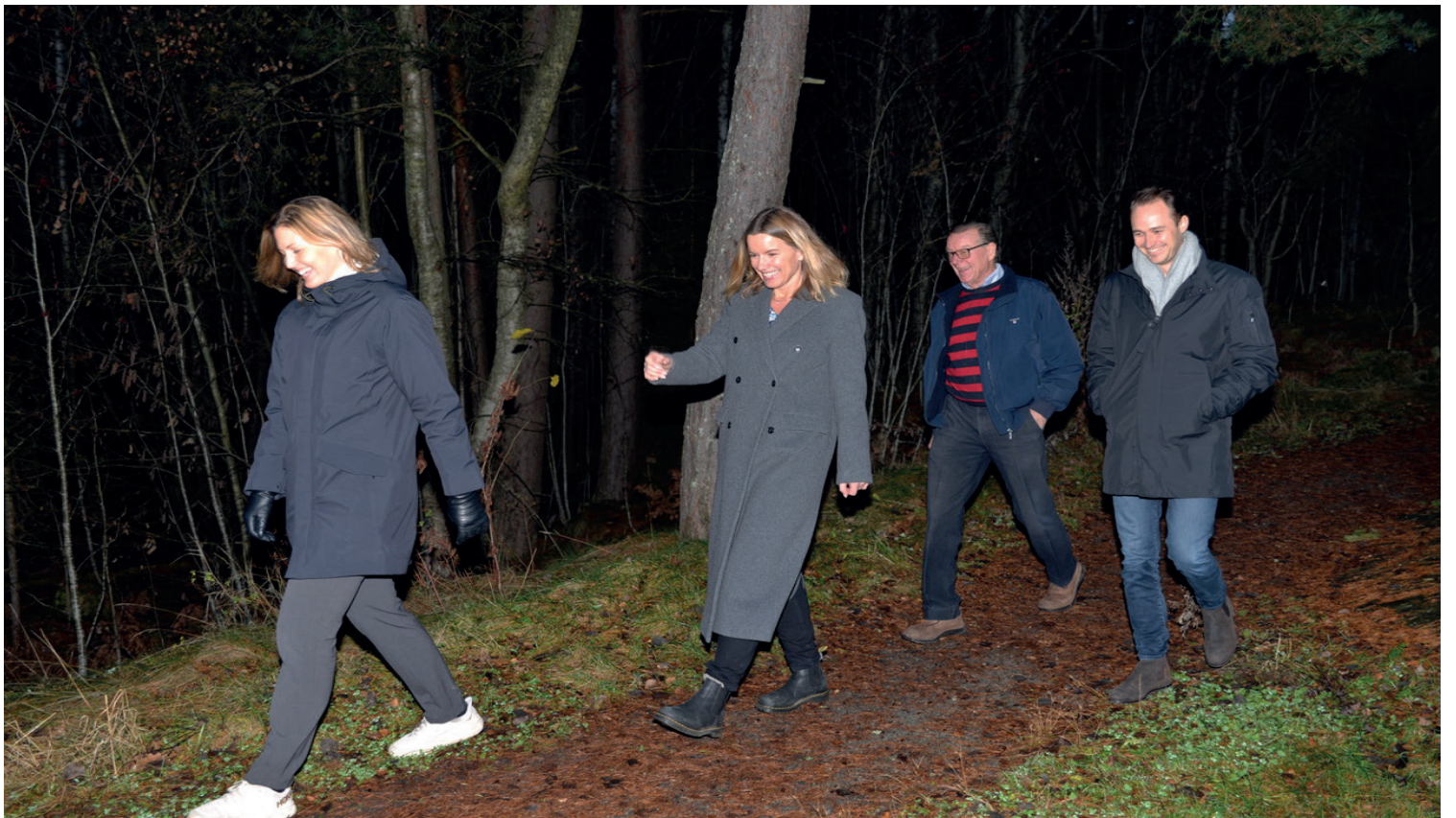
Fritt etter «Napoleon med sin hær» marsjerte ordfører (i midten), prosjektledere og gründer på befaring.