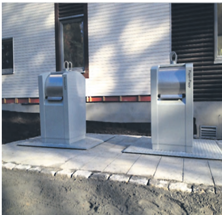
Et eksempel på helt nedgravd løsning.

Det gir prosjektet og området en miljøvennlig renovasjonsløsning.