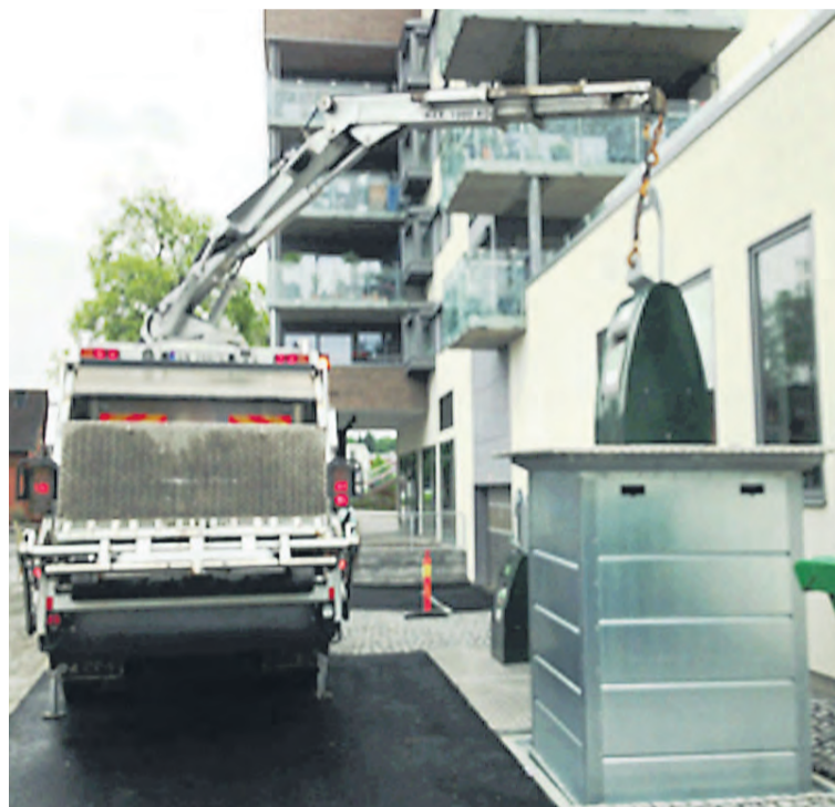
Tømmebilen løfter opp avfallet fra de nedgravde beholderne.