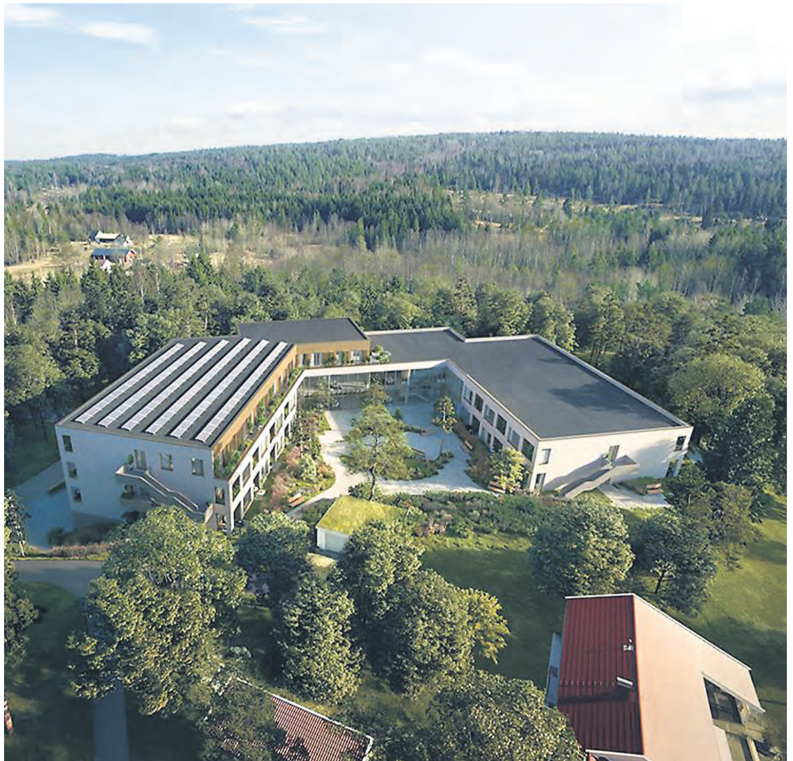
Selve bygget er formet som en hesteko som åpner seg mot sydvest og danner et atrium som omkranser en flott hagepark.