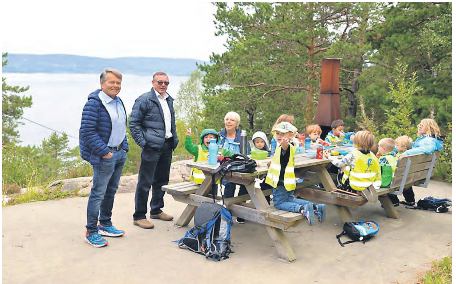
Barnehagebarn er allerede hyppige gjester på Sofienlund/Oleanas utsikt. En yndet raste- og lekeplass.