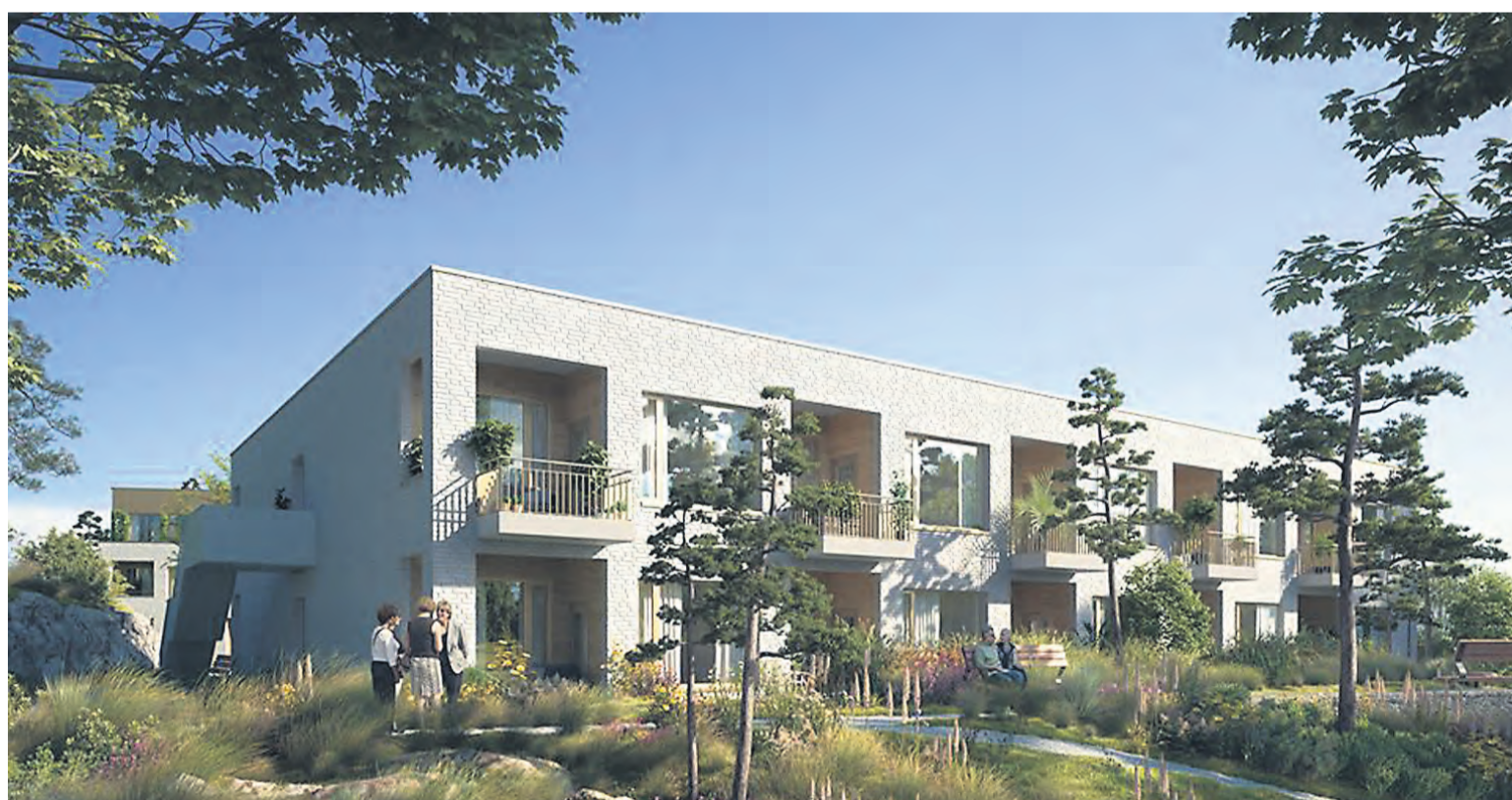
Fjellstrand er et lite tettsted på Nesodden noen få km nord for Fagerstrand, og har en fantastisk beliggenhet på vestsiden av Nesodlandet.