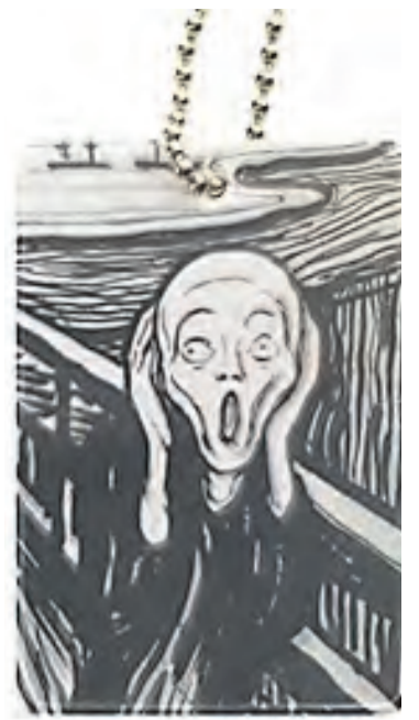
Alle godkjente refleks skal være merket med CE EN 13356.

Refleksvesten blir dårligere ved vask og bør byttes årlig ved jevnlig bruk.