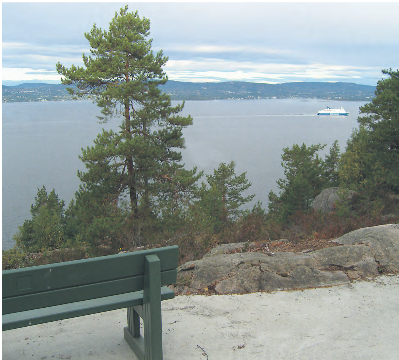
Praktfull utsikt fra Sofienlund.