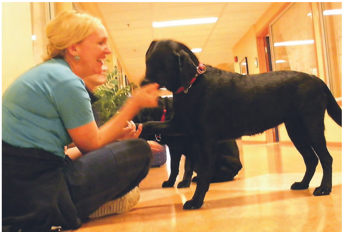
Her sitter Bitte Schou og koser seg med Fendi.

Fendi har nå lært å gå i bånd, kommer på innkalling, kan nesten rulle rundt, sitter og blir, ligger og blir liggende. Nå trenes det på å gå slalåm. Fendi elsker