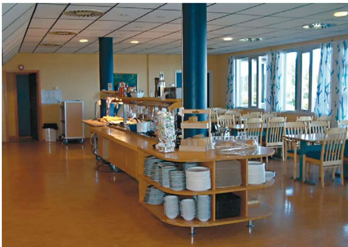
Restaurantavdelingen er innbydende, men alt for liten. Derfor gleder alle seg til den etterlengtede utvidelsen.