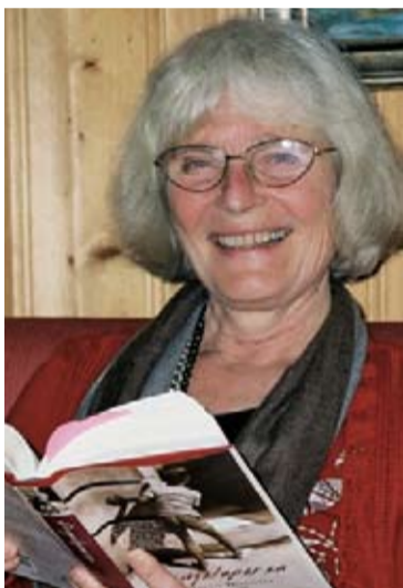
Av Ingeborg Maach