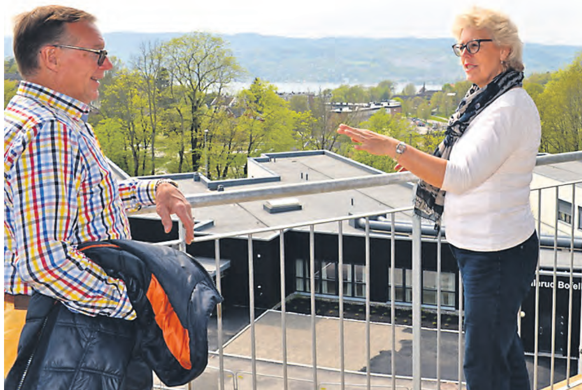
Drøbaksundet på den ene siden, og Drøbak Golfklubb på den andre siden av Ullerud Helsebygg.