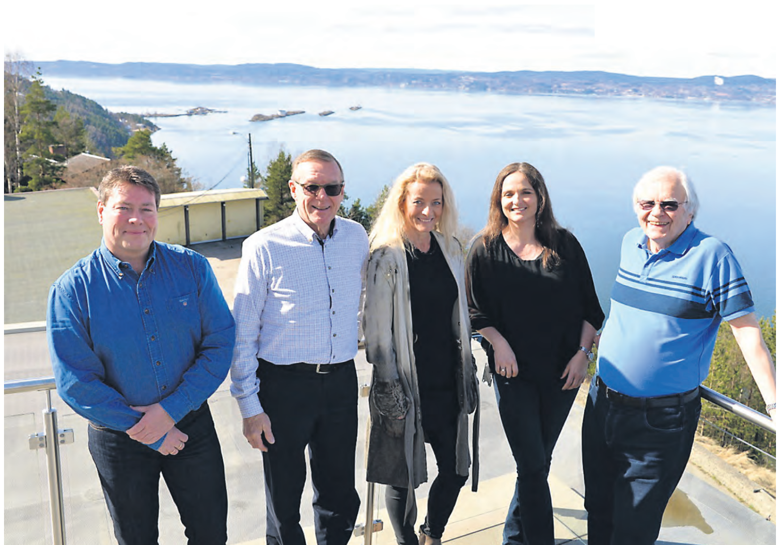
I matpausen stilte alle fra Workshopen opp utendørs. De har omtrent samme utsikt til Oslofjorden fra Sunnaas som vi har fra Sofienlund.